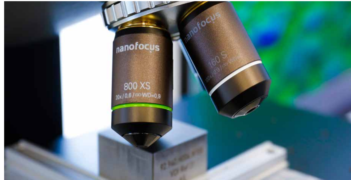
Ob Kunststoff, Glas oder Metall - mit dem NanoFocus-3D-Mikroskop \mu surf können mikroskopisch kleine Details der Oberfläche nanometergenau vermessen werden

Jürgen Valentin: Vor allem die schrumpfende Dimension elektronischer Bauteile: Smartphones, die intelligente Bordelektronik oder automatisierte Maschinen sind vollgestopft mit Mikrotechnik, hinzukommen