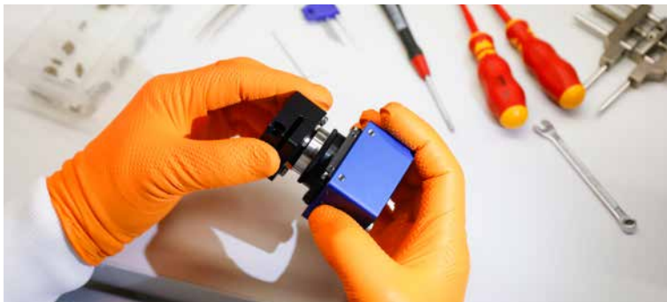
NanoFocus entwickelt und produziert seine Systeme komplett am Standort Oberhausen. Die Fertigung, Montage und Einrichtung der Sensoren erfordert höchstes fachliches Know-How.